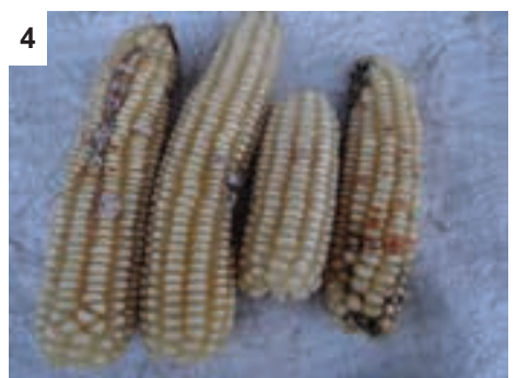
4 Ka tlwaelo diboko tša Busseola fusca di phatlalatša dikapeu tša fankase mafelong.