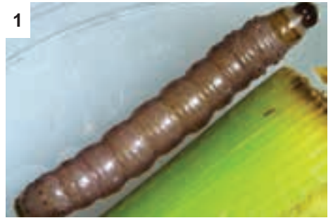
1 Diboko tša B. fusca mafelong.