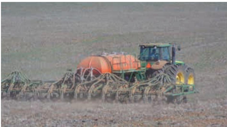
Pšalo ya korong lefelong la Overberg.