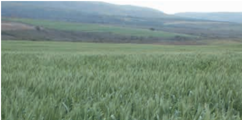
Dula o gopotše setšweletšwa sa gago sebopegong sa sona sa mafelelo ka mehla.