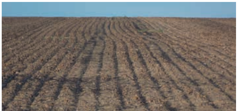
Mašemo ao a fišitšwego.