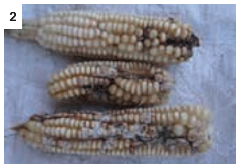
2 Polo ya mafela ya “Fusarium” leheeng le lešweu. (E. Ncube)