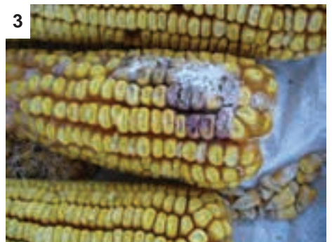
3 Polo ya mafela ya “Fusarium” leheeng le lesehla. (E. Ncube)